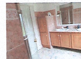
Salle d'eau avec double vasque

WC indépendants (porte donnant dans la salle d'eau)