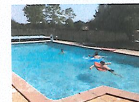
Piscine 10 X 5 m

Visite de la mini-ferme et de ses animaux sur demande (gratuite pour les hôtes), accueil possible de votre cheval en pré ou en box (nous contacter)