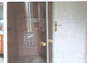
Douche à l'italienne