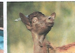
Salto, gentil bouc sauvé de l'abattoir