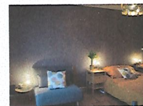
Lit et canapé convertible

Télévision, Wi-fi, petits-déjeuners servis en chambre ou en extérieur en supplément (5 € par personne)